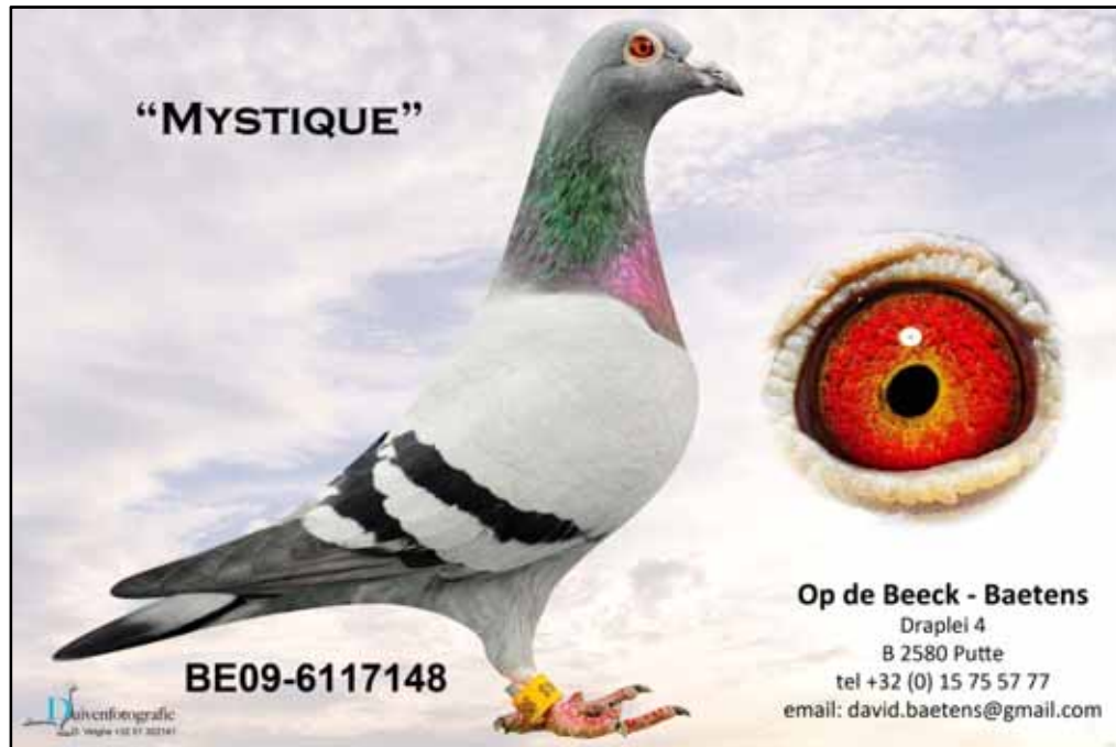
オブ・ドベークパーテン作翔の“ミスティーク”(供出鳩の母)

1,585 羽中優勝、同P7,510 羽中総合 5 位、ブルジュN37,357 羽中総合 55 位 半兄弟 / ロイヤル・ジェット・ジュニア、プラカス、スペンサー 祖父)サムソナイトB04-6460098 マリーナ・ファンデフェルデ作 直仔 / 06-382 優勝 3 回他 サムソン (アルジャントンN23,419 羽中総合優勝、同 33,097 羽中最高分速) × デュシェイン = シェールス 祖母)300 B02-6035300 オブ・ドベーク = パーテンス作 基礎鳩ゾット × ファンダイク作カンニバルの娘