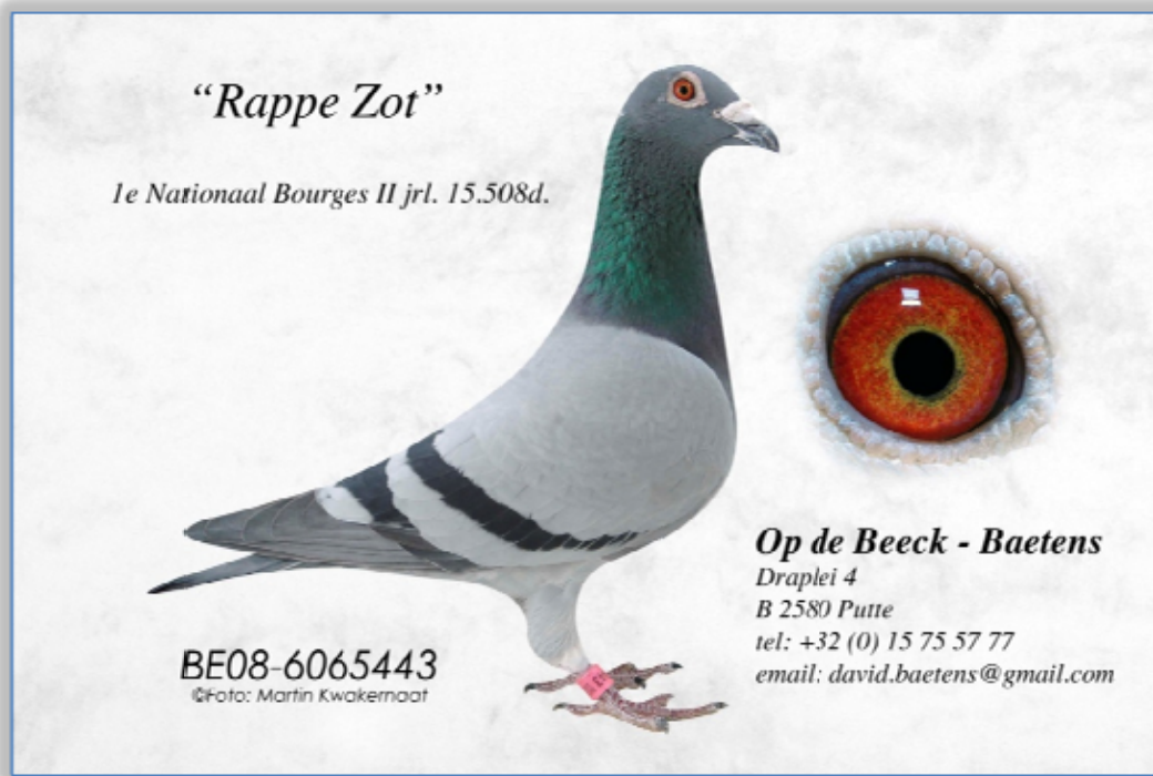
オブ・ドベークバーテン鳩舎作翔の“ラーパ・ゾット”(供出鳩の父)

祖母)インテュイション NL 00-1976014 LBC フェルケルク父子作 01年WHZB最優秀雌鳩第18位 ビッグ・サンダー×ハット・フロイゲルチェ