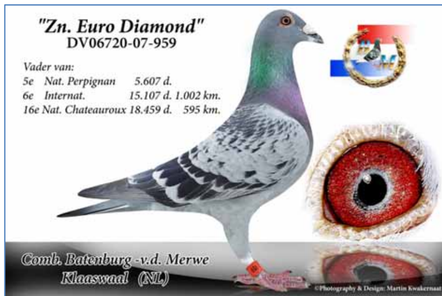
バーテンブルグ = ファンデメルヴェ 供出鳩の父“ゾーン・ユーロ・ダイヤモンド”

祖母)NL02-1764832DC プロア・05×ミス・ベルジェラック(サンバンサンN7,999 羽中総合 13 位他)