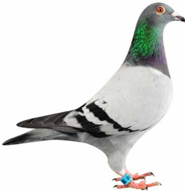
リック・ヘルマンズ使翔 カウ・ガールの直仔 “ゾーン・カウ・ガール”

祖母)トルテリの娘B01-5012363 孫/トゥレ・031 トルテリ(ラ・スーテレーヌN総合優勝、サンドニ401 羽中優勝、同130羽中優勝、ドールダン298羽中優勝、同143羽中優勝他)×ヴァイア・コンディオス