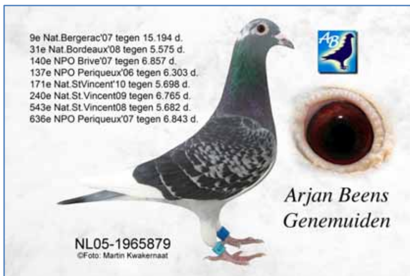
アルヤン・ビーンズ鳩舎供出鳩の母“ド・スーパー・879”