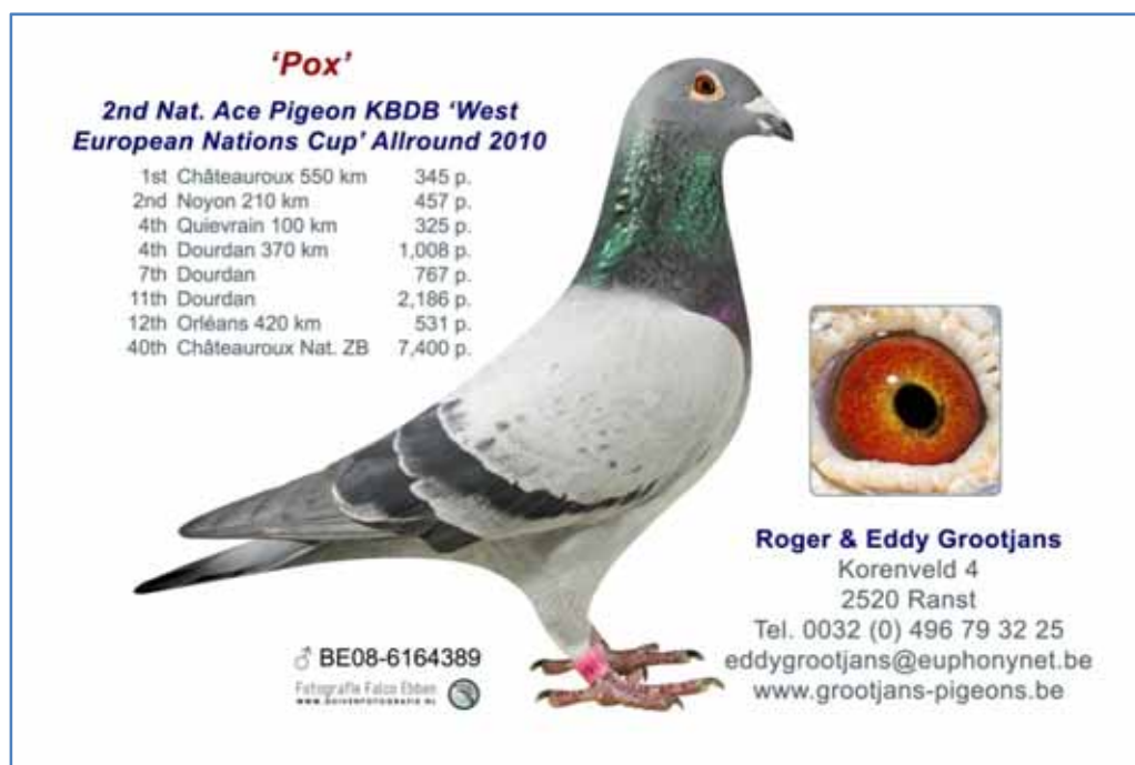
エディ・グローチャンス作翔 “ボックス”(供出鳩の父)

[29] NL11-1761411 BC ペーター・ファンデルヴェ作 ジョイの娘 父) ユナイテッド NL09-1192935 BC P. ファンデルヴェ作翔 TBOTB 若鳩Nエース鳩第2位ペロンヌ 1,967羽中優勝、同P23,022羽中総合3位 ストロームベーク 608羽中優勝、同283羽中優勝他 祖父) アド NL04-2179361 B A スカーラーケンス作 直仔/ペロンヌ P11,346羽中総合優勝~4位、 同30,371羽中最高分速 サンカンタン 1,685羽中優勝、ハルキーズ 1,207羽中優勝、ペロンヌ 1,967 羽中優勝、クライル P25,745羽中総合3位、アブリス N17,730羽中総合18位他 セCOND・エース ×夏仔 01-992 祖母) オヴィタ NL00-5054139 BCP. ファンデルヴェ作翔 シャトロー 1,019羽中優勝、同N12,520 羽中総合11位、ポン 5,137羽中2位、ストロームベーク 4,421羽中2位、リブラモン 3,666羽中2 位 デヴィット兄弟のスーパー・ブリーダー・048×B&W共同鳩舎作 ゴールデン・アイ 母) ジョイ NL08-1545445 B P. ファンデルヴェ作 Bアブリス NPO15,871羽中総合優勝、同78,219 羽中自動車獲得 兄弟/セザンヌ NPO21,720羽中総合2位、シャトロー NPO7,335羽中総合19位 直 仔/ストロームベーク 302羽中優勝 祖父) アミーゴ NL05-1400951 BC P. ファンデルヴェ作翔 優勝3回 アブリス 4,568羽中総合 2位、ペロンヌ 44,240羽中総合4位、クライル 38,401羽中総合16位他 リプレイ×ブラック・872 祖母) セネ NL05-1400857 BC P. ファンデルヴェ作翔 マリエンプル 3,283羽中優勝、ポメロイ ル 2,515羽中優勝、シャンティー 2,225羽中2位、シャトロー P22,571羽中総合58位 パウワー× ファヴォリーチェ