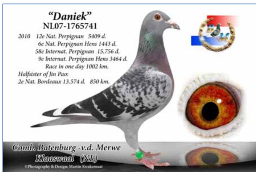
バーテンブルグ = ファンデメルヴェ 供出鳩の母“ダニーク”